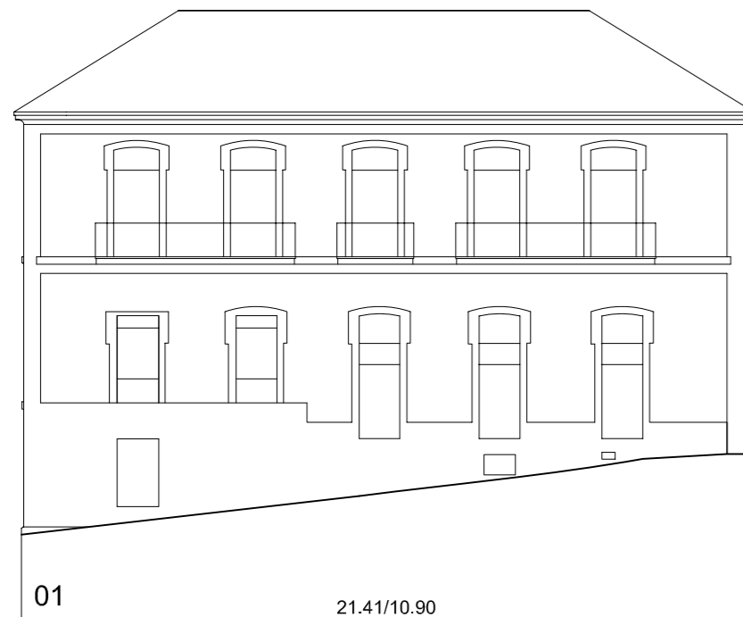
Travesía Rúa da Palma - Rúa da Oliva