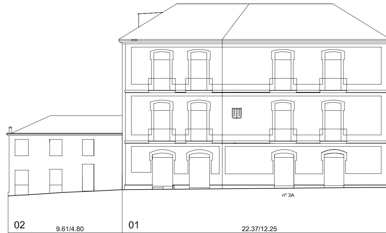
Rúa da Oliva