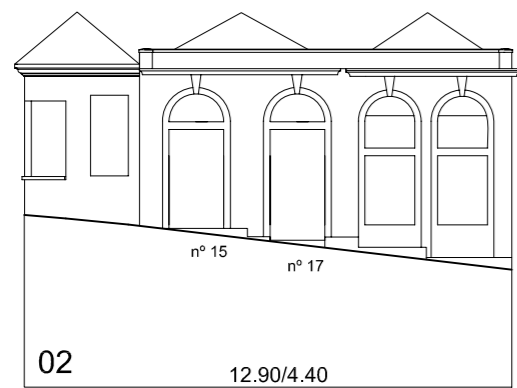
Rúa de Joaquín Yáñez