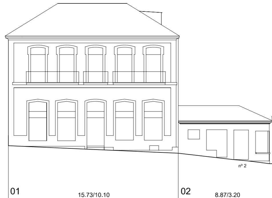
Rúa da Palma

Nº PARCELA FRENTE PARCELA/ALTURA DE CORNIXA (COTAS EN METROS)